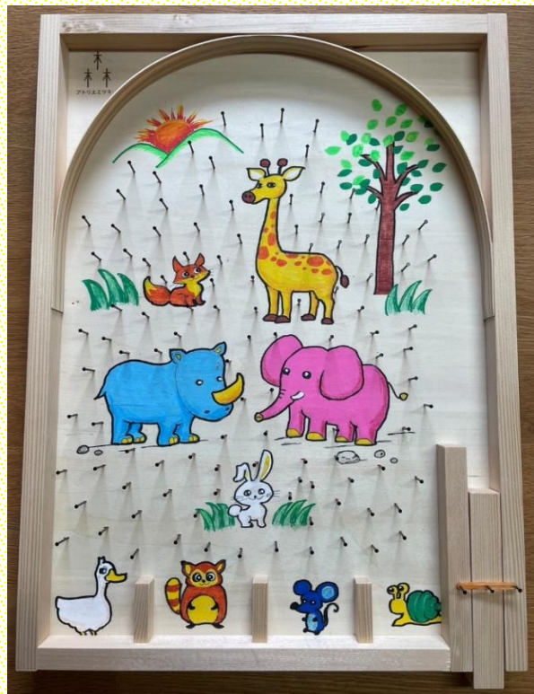
【ピンボールサイズ：約35cm×47cm】