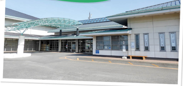
福富公民館 (「福富ゆうあい館」の中にあります)

以上の歴史があり、子どもたちは地域の伝統芸能に触れながら成長しています。浮立で演奏する太鼓の指導者や太鼓の数にも恵まれていることから、公民館では年代を問わず、太鼓に親しんでもらおうと講座を企画しました。子どもから大人まで、全身運動としての効果も感じられる体験ができました。そんな太鼓の楽しさとともに、浮立の魅力をこれからも伝えていきたいと思えます。