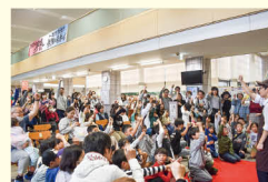
▲実行委員によるじゃんけん大会