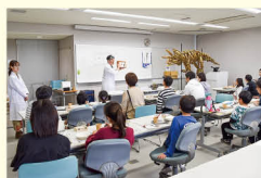
▲化石標本づくりワークショップ