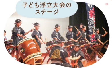
子ども浮立大会の ステージ