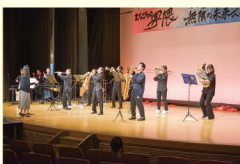
▲中・高校生による 吹奏楽演奏のステージ