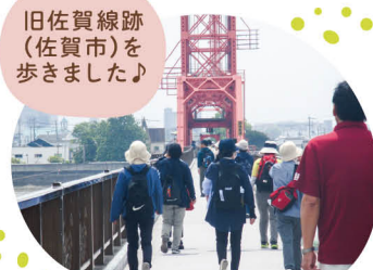
旧佐賀線跡 (佐賀市)を歩きました!

また、福富地域には9つの地区ごとに伝承されている浮立があり、地元の小学生が夏休みに練習して披露する「子ども浮立大会」が毎年8月25日に開催されます。この行事は50年