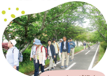
ウォーキング講座

公民館は約15年前に現在の福富ゆうあい館内に移ってきましたが、集会や文化活動の場として定着してきたと感じています。今後も気軽に訪ねて来てもらえる場所でありたいと思います。窓口で声をかけてもらった時は嬉しいですし、顔なじみの関係になる中で、地域の方の考えやニーズが見えてくるので、声を聴く姿勢は大事にしたいですね。そして、ここの活動が日常の一部であったり、リフレッシュしてホッとできる時間になったりすることで暮らしがより豊かになる、そんな場所として地域の中にあり続けたいと思います。