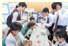
▲ハーバリウムボトル体験