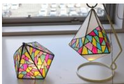
【ランプの材料と道具】