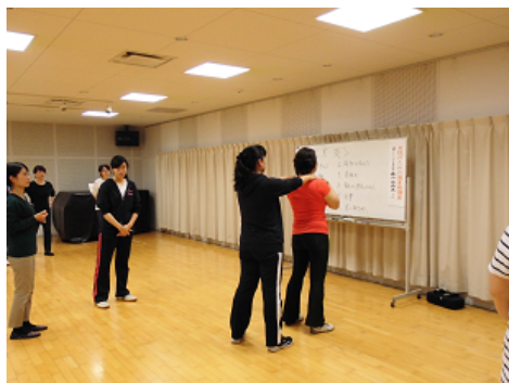
後半の実技の様子