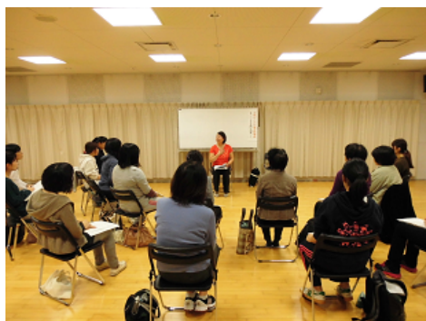
レクチャーの様子