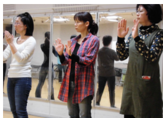
レディ・スタンス