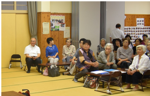
参加者のみなさんは、真剣に聞き入っていました。 講座で学んだ知識を活かして、健康的な毎日をお過ごしください！

「節度ある適度な飲酒」の目安は「2ドリンク」で、体内から消失するまで4時間かかるそうです。 スライドと配布資料で、わかりやすく説明していただきました。