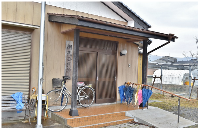
2月15日(木)に白石町の網代公民館で、「網代区老人会」主催のふるさと学講座を開催しました。

さが県政出前講座では、佐賀県の取り組みを広く県民のみなさんへ知っていただくために、県職員がみなさんのまちや職場へ出かけて講座を開催しています。