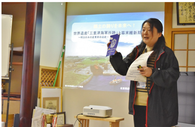
肥前さが幕末維新博事務局 担当職員による約1時間の講座でした。 あいにくの雨でしたが、20人以上の老人会 会員さんが参加されました。