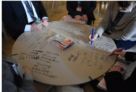
5~6人でグループを作り、円卓ボード (えんたくん) を膝にのせ、気づきや自分の考えなどをメモ

事例研究の後、参加者同士で事例の感想や気づきを交換する時間を設けました。グループセッションでは、事例報告者からみんなと考えたいお題が提出され、参加者それぞれがお題を選択してグループをつくり、話し合いが始まりました。グループワークには、直径1mの円卓ボード (えんたくん) を活用。いつものテーブルワークとは違った雰囲気の中、活発な意見のやりとりが見られました。