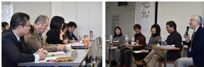
総括フォーラムの様子

最後に、「続けていきたい未来を自分たちで考えることを忘れてないでほしい」「つながりの先に、より良い地域が実現できる『協働』を目指して」とエールを送っていただきました。