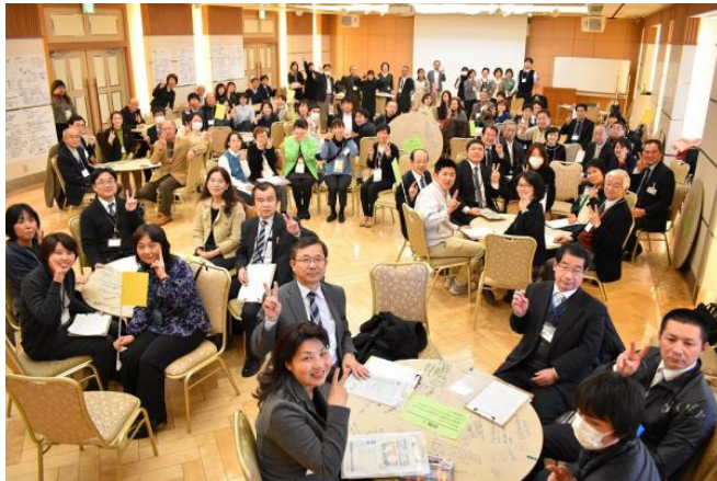
▲一緒に語り、学び合ったみんなです！👏👏👏

■コンファレンスに参加、関わっていただいたすべての皆さま、ありがとうございました。ここでの出会い、発見、学びが、それぞれの地域での課題解決への糸口になれば幸いです。学びを通しての人のつながり、支え合いを育む社会教育のチカラで、これからの佐賀、地域を共につくっていきましょう！