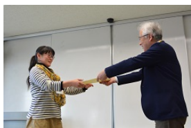
閉講式では、規定時間数以上受講された24名の方に修了証を交付しました。