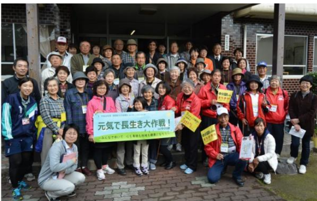
▲中川副公民館玄関前で集合写真 皆でにっこり ハイチーズ📷

参加者からは「いつもは1人で歩いていますが、皆さんと一緒に歩いて本当に楽しかったです」「こんなところに恵比寿さんがあったなんて、長く住んでいても知らなかったです」「いつもは車で移動しているので、ゆっくり歩いてみるといろんな発見がありました」などの声があがり、発見の多いまち歩きとなりました。