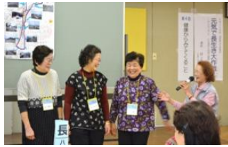
▲ウォーキングコースの地図を完成させて発表