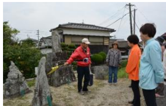
▲まちづくり協議会による歴史名所のガイド