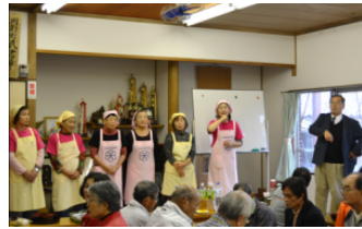
▲昼食会 中川副食生活改善推進協議会による減塩のふた汁とおにぎりは参加者にも大好評 「健康のためにも塩分の取りすぎには気を付けて」と呼びかけられました。