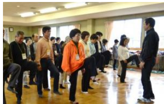
▲ウォーミングアップ体操