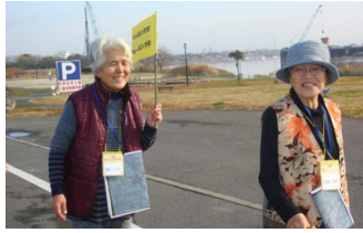
▲自分で考えたコースをウォーキング