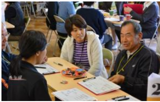
▲グループワーク ～私の健康法について～