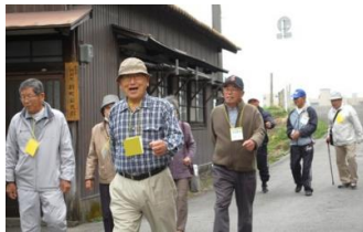
▲4つのグループに分かれてまち歩き