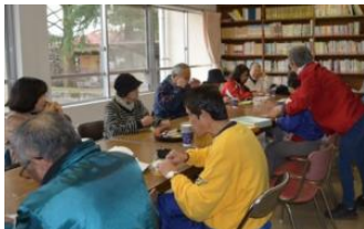
▲交流タイム(図書室)