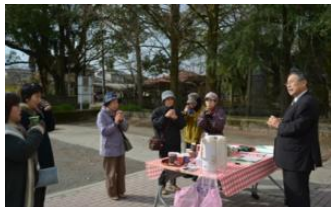
▲カフェコーナー(公民館の玄関前)