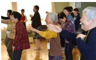
▲健康体操は笑い声が絶えず毎回好評でした。