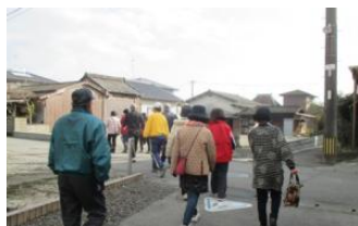
▲短・中・長距離コースに分かれてウォーキング