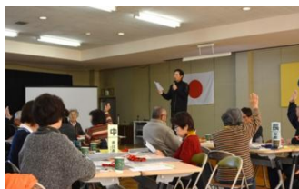
▲健康チェック 1回目の測定と比較しました