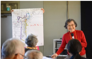
▲グループワーク ～短・中・長距離に分かれてウォーキングコースづくり～