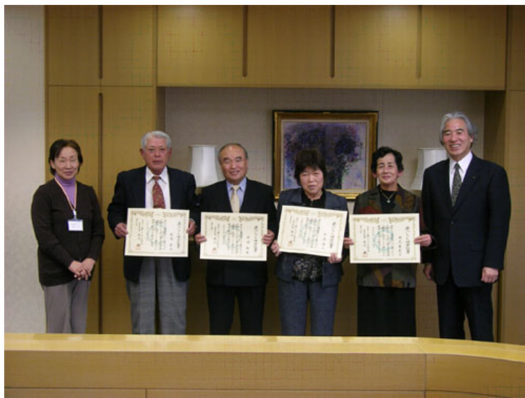
【3月18日(木)授与式の様子】