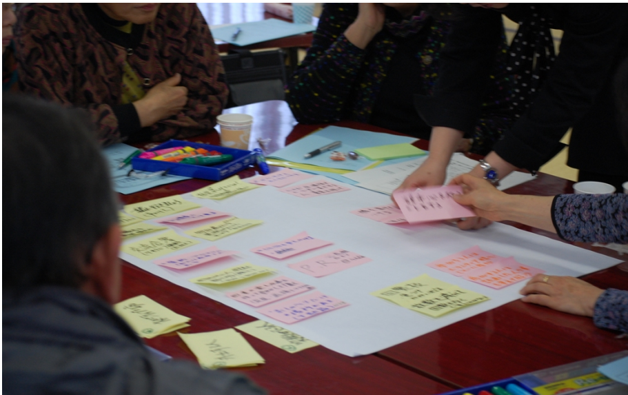
さまざまな意見やアイデアが飛び出しました。