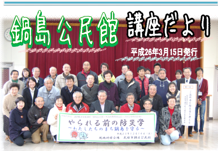
②同日・現地特設会場「佐賀県市公民館」にて