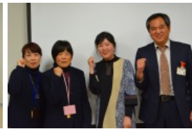
●佐賀市立富士生涯学習センター