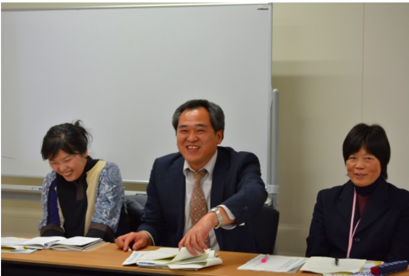
■スライドショーの後は、アバンセ職員や市町担当者、そして講師の皆さんで、これまでの振り返りの気づきや今後の取り組み等について語り合いました。