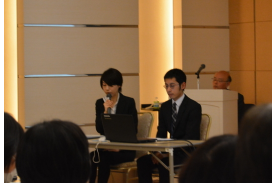
●多久市南多久公民館