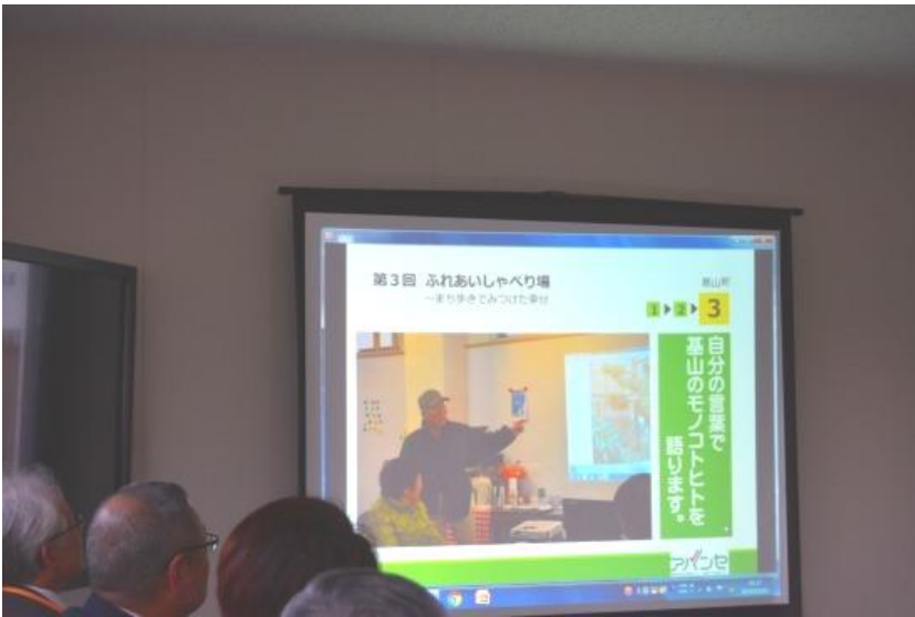
■3市町の講座の様子などをまとめたスライドショーを見ながら振り返りを行いました。