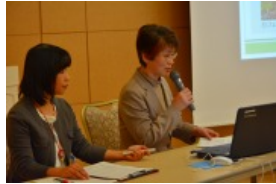
●佐賀市立富士生涯学習センター