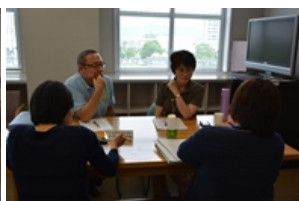
★富士生涯学習センター