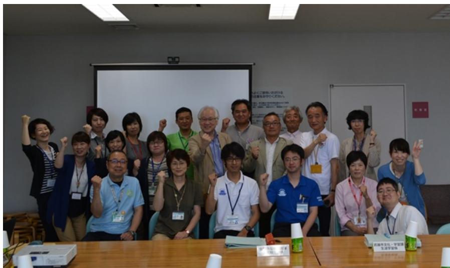
📷 集合写真「みんなでがんばろう〜！」