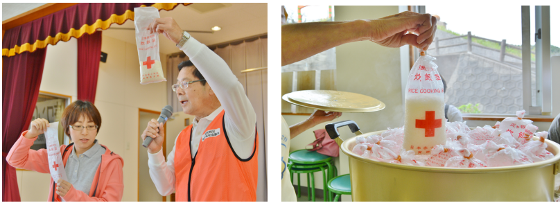
公民館長さんより、カレーライスのご飯は、災害用の炊飯袋を使って炊いているという説明がありました。