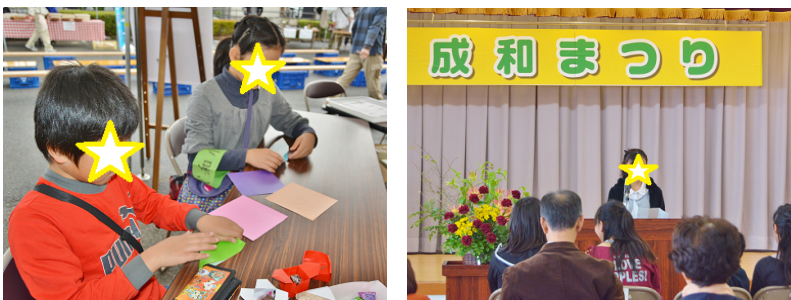
折り紙を応用した「災害時の食器づくり」の体験コーナーも設けました。