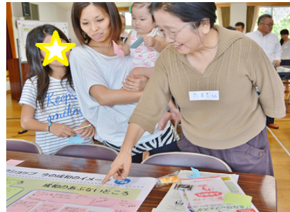
ワークショップでは、成和校区の「よいところ」と「あぶないところ」を自由に出し合い、ワークシートに記録して行きました。大人が子どもたちに昔の様子を話したり、子どもから出た意見に大人たちが感心したり、世代を越えた意見の交換がありました。