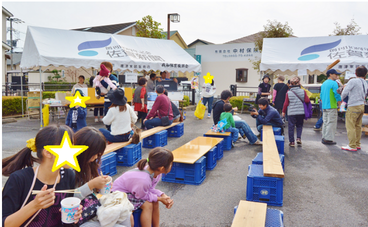
講座に参加していない住民の方々にも、講座の内容を伝え、まちづくりや防災への意識を持ってもらえるように、成和校区の一大イベント「成和まつり」に出展しました。