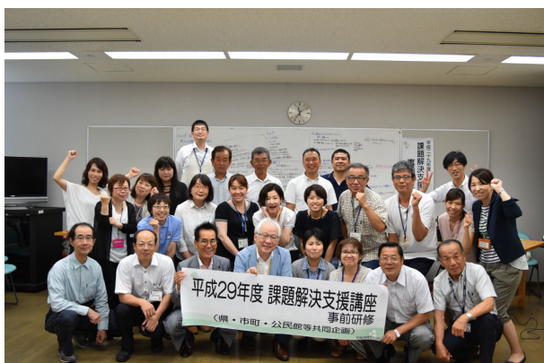
「がんばるぞー！」とみんなで記念写真

今年1年やったから、すぐ課題が解決するわけではなく終わりではありません。3～5年かけて継続していくことが大事です。次年度にどうつなげていくのかも考えながら取り組んでください。