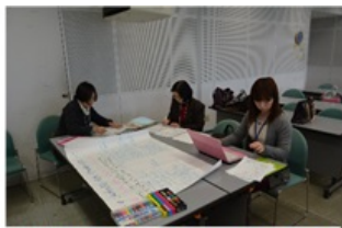
地域の子育て環境・各組織の連携についての研究