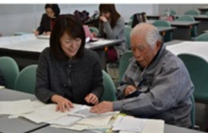
親の絆と親友についての研究

★講座の詳しい内容は、「 ステップアップリーダー講座通信No.6 (444KB; PDFファイル)」をご覧ください。