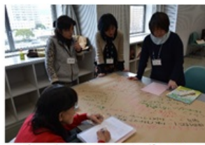
子育て中のメンタルサポートについての研究