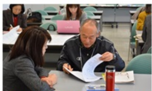
学童保育【集団生活の中のルールと価値観】についての研究