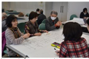
親への支援について<親子の遊びと成長>の研究