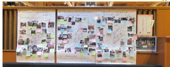
▶ フォレスタふじ館内に掲示