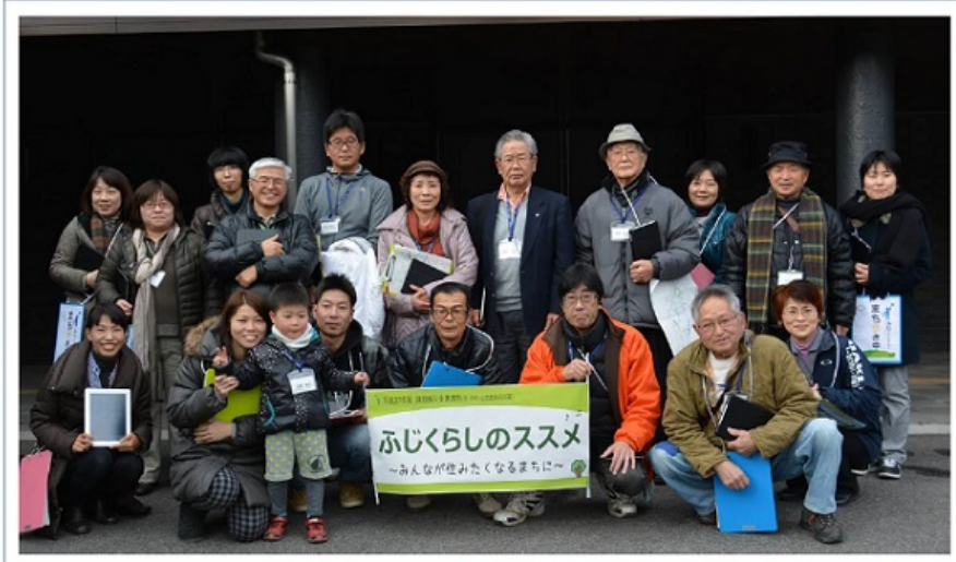
▶ 佐賀市立富士生涯学習センター前にて (第 2 回目講座 まちあるき) ▶ 右上の「ふるゆ♡」は、まちあるきで見つけた石畳の名所にあった石の文字

▶富士町は、高齢化率が 36% を超え、3 人の内の 1 人が高齢者のまち。そしてスーパーやタクシー業者が姿を消していき、小学校の統廃合や支所再編など、近年、まちのあり方が変わりつつあります。