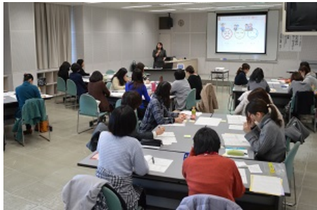
第1回「アサーション研修」(H28.1.30)の様子